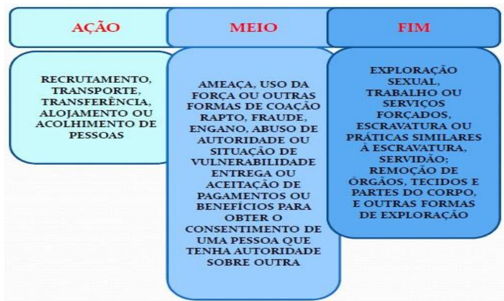
Figura 1 (Ministério da Justiça, 2013): Conceito de Tráfico de Pessoas

Do conceito, apreendemos que são necessários três elementos para que o tráfico de pessoas se configure, ou seja, a ação, o meio e a finalidade, segundo a Figura 1 (Ministério da Justiça, 2013):